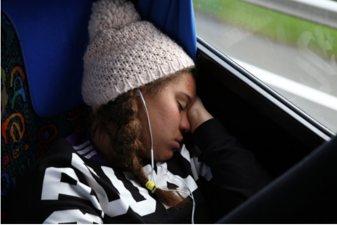
Retour en bus