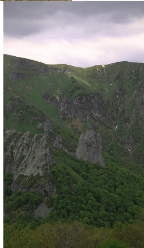
La dent de la rancune, dans la vallée de Chaudefour