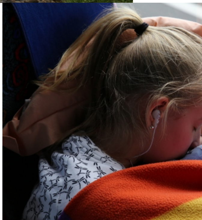
Retour en bus