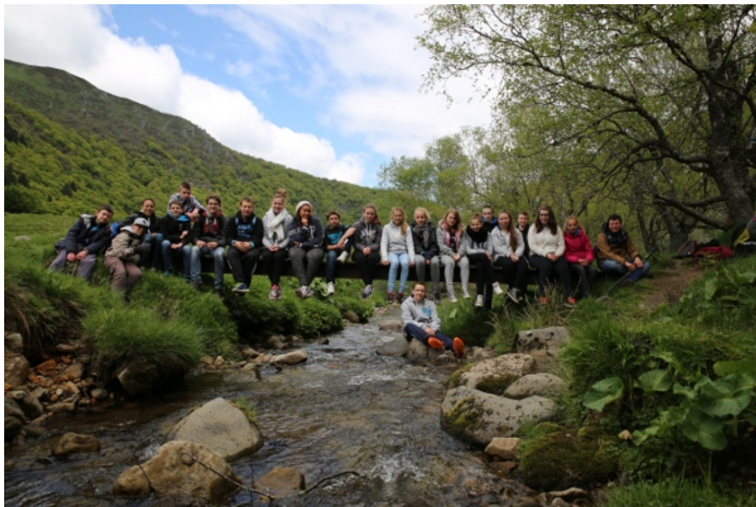
La classe de 4e5 en bas de la vallée de Chaudefour