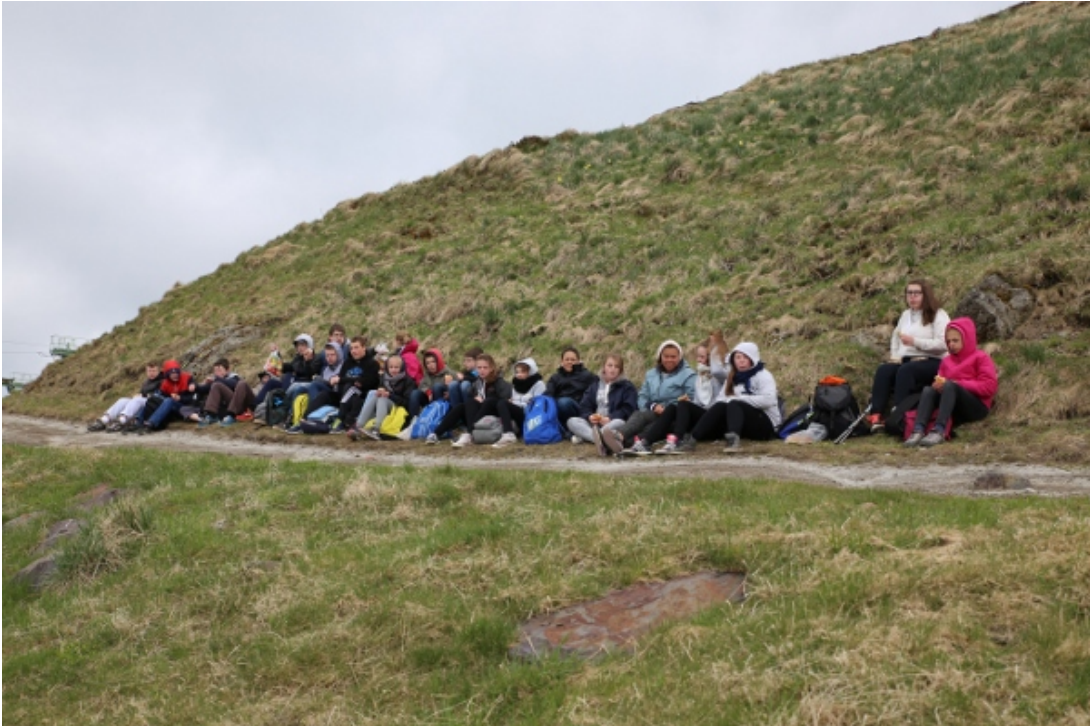
Pique nique à l'abri du vent, en haut du Sancy

Après un lever matinal, les élèves ont entamé la journée avec une forte ascension de plus 500 mètres pour accéder au Puy de Sancy, avant de redescendre par la vallée de Chaudefour (dénivelé : 700 m).