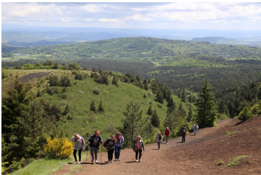
Montée au sommet du Puy de Lassolas