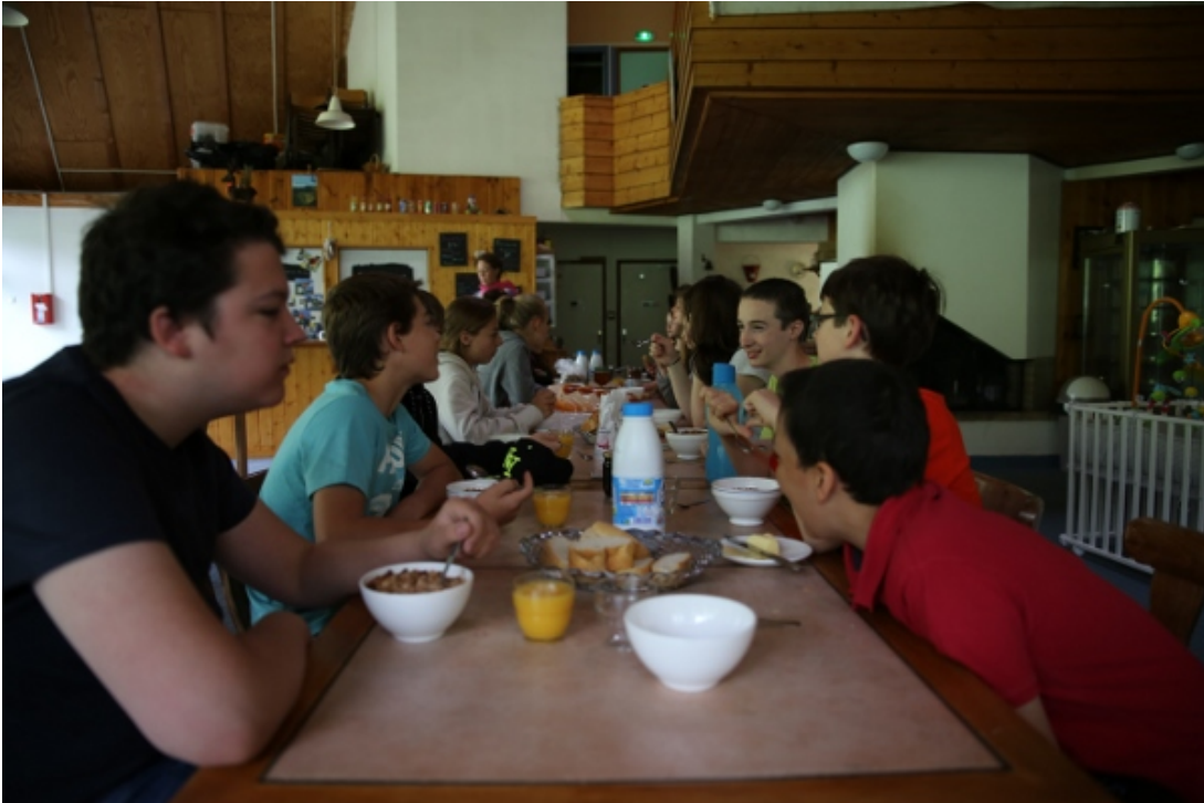
Mercredi 20 mai : petit déjeuner

Après le petit déjeuner, tandis qu'un groupe d'élèves s'occupait de la vaisselle en cuisine, un autre groupe était chargé de préparer les sandwiches pour le midi.