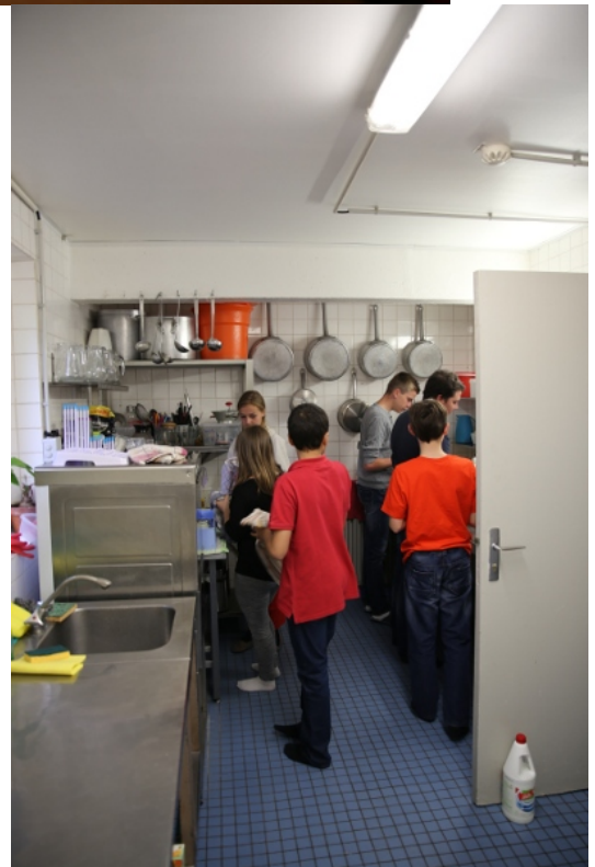
La vaisselle, en cuisine

Nous sommes d'abord montés au sommet du Puy de la vache, puis sur son voisin et jumeau : le puy de Lassolas.